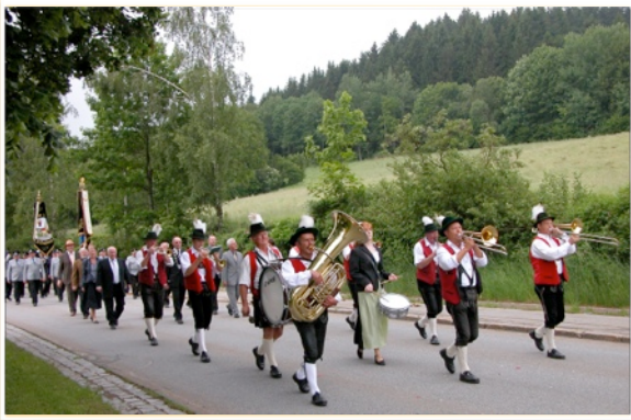
Blasmusik und Vereine